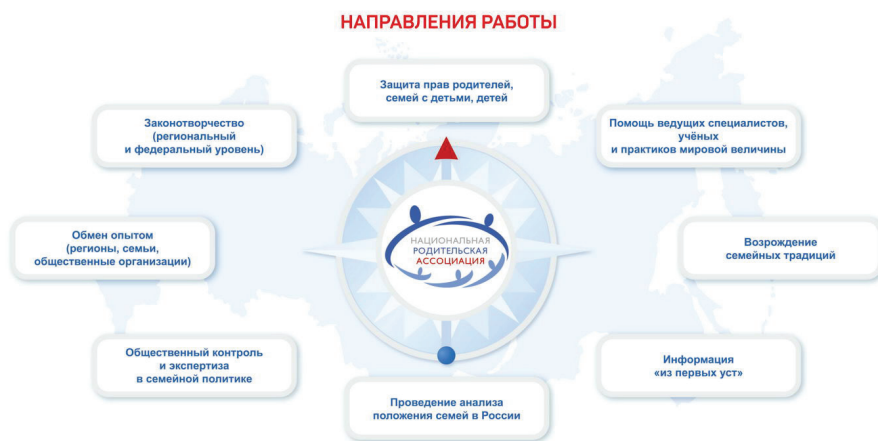
Рис. 1. Основные направления деятельности Национальной родительской ассоциации

Национальная родительская ассоциация призвана объединить дружественные семье силы гражданского общества, подключить их к процессу выработки государственных решений в сфере единой национальной семейной и демографической политики. Цели национальной родительской ассоциации - обеспечить эффективное сотрудничество общественных и государственных структур, участвовать в формировании политики в интересах семей, программ и законов, выступать с инициативами в области семейной политики, защиты интересов семей с детьми, материнства, отцовства, профилактики социального сиротства. Задачи национальной родительской ассоциации - БЫТЬ ПОЛЕЗНОЙ ДЛЯ КАЖДОЙ СЕМЬИ РОССИИ.